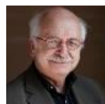
Erik Orsenna – Président d'honneur